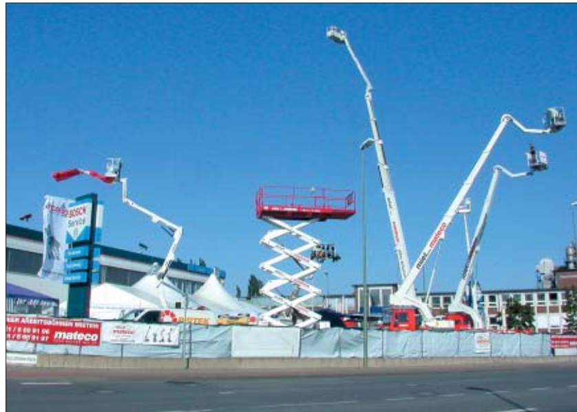
Hoch hinaus ging es bei der Eröffnungsfeier am 10. September 2004 auf dem Firmengelände in Bielefeld.