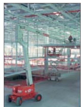
Bundesweit im Einsatz: Die rund 2.180 Arbeitsbühnen der mateco AG.