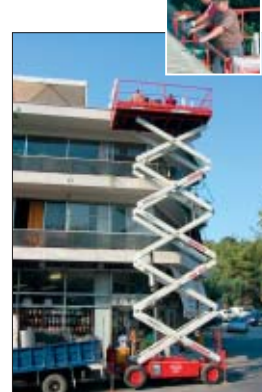
Eine Scheren-Arbeitsbühne der mateco Hellas im Einsatz für Olympia.

Um das erforderliche, sperrige Equipment schnell und trotzdem sicher zu bewegen, fungierte eine Scheren-Arbeitsbühne der mateco Hellas als Transportaufzug.