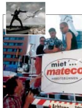
Georgiew fotografiert Rudolf Schenker für seine Sammlung Mannsbilder.

Um Rudolf Schenker, dem Gitarristen der Scorpions, auf dem VW-Turm am Raschplatz in Hannover in 87 Meter auf Augenhöhe zu begegnen und ihn nahe am Abgrund perfekt zu fotografieren, waren die Dienste der größtmöglichen mateco-Arbeitsbühne gefragt.