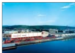
Die Firmenzentrale der Scholpp Kran & Transport GmbH in Stuttgart.