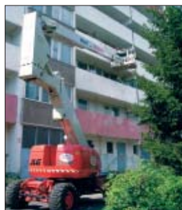
Zeitersparnis mit der TG 264 K D 4x4 S gegenüber einer Anhängerbühne.

Fassadensanierung am Seniorenheim in Berlin, Ketschendorfer Weg, lautete der Auftrag für die Firma Wentzel & Belling aus Zepernick. Die schmale, kompakte Bauweise sowie eine Wegbreite von 2,50 m ließen nur den Einsatz einer Teleskop-Gelenk-Arbeitsbühne TG 264 K D 4x4 S zu.