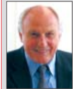
Liebe Leserinnen, liebe Leser,

„die Zukunft gehört denen, die bereit sind in der Gegenwart zu handeln“. Dieses Zitat gibt kurz das wieder, was uns in der Vergangenheit dazu verholten hat, um an die Position zu gelangen, an der wir heute stehen: Führender Arbeitsbühnen-Vermieter in Deutschland und Europa.