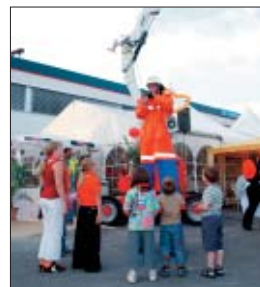
Nicht nur die kleinen Besucher mussten weit nach oben blicken.

Die Kooperation mateco-Kalveram wird von beiden Unternehmen als zukunftsweisendes und viel versprechendes Pilotprojekt betrachtet.