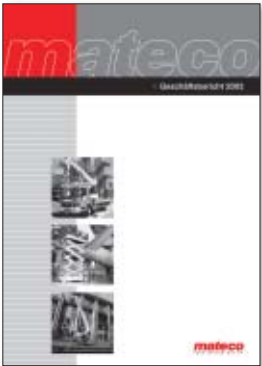
Das wichtigste Instrument der Finanzkommunikation zu unseren Kunden und Partnern ist der Geschäftsbericht.

DER ERSTE GESCHÄFTSBERICHT DER MATECO AG FÜR DAS GESCHÄFTSJAHR 2003