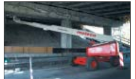
Auch bei großer seitlicher Reichweite ein schnelles und sicheres Arbeiten.

An der stark befahrenen Autobahn Schlesien – Kreuzung der A4 mit der E75 (künftig A1) musste die wichtige Autobahnbrücke in Katowice in kürzester Zeit umgebaut werden. Durch den Einsatz einer T 160 D und T 200 D wurde der Umbau durch die Firma Polbet aus Katowice zügig beendet.