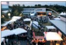
Studio Berlin Adlershof ist bekannt für seine außergewöhnlichen Events.

Auf dem Firmengelände wurde zu Präsentations- und Aufnahmzwecken eine geeignete mateco-Arbeitsbühne benötigt.