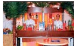
Die köstlichen Cocktails wurden teilweise artistisch geschüttelt.