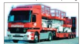
Transport von Arbeitsbühnen.

Zum 01.01.2005 wird die LKW-Maut in Deutschland eingeführt. Neben den unmittelbaren Mautgebühren haben wir nach Einführung der Maut noch weitere Kosten, bedingt durch Verwaltung und Steuerung innerhalb des Unternehmens sowie der Vorfinanzierung der Maut, zu verkräften. Wir sehen uns daher veranlasst, Ihnen ab Einführung der LKW-Maut die uns entstehenden Kosten mit aktuell 16 Cent pro Mautkilometer für den An- und Abtransport unserer Arbeitsbühnen mit unseren eigenen Transportfahrzeugen in Rechnung zu stellen. Im Gegensatz zu unseren Transportfahrzeugen sind unsere LKW-Arbeitsbühnen (selbstfahrende Arbeitsmaschinen) nicht mautpflichtig.