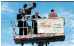
Die Geschäftsleitung von Studio Hamburg ließ sich in die Höhe befördern.