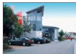
Ganz schön zackig: Der Stammsitz der mateco AG in Stuttgart.