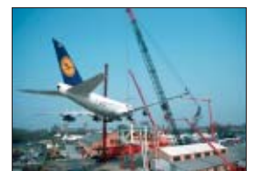
Perfekte Landung mit Hilfe des Scholpp Kran & Transport-Equipments.