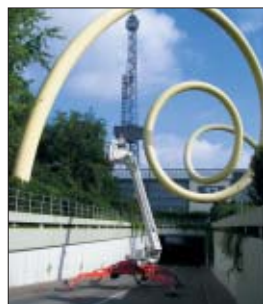
Die Berliner Firma Rossow arbeitete mit einer XT 252 B/E KE am Rohrkunstwerk.

Das Rohrkunstwerk auf dem Messegelände Berlin bedurfte eines neuen Anstrichs. Die Firma Rossow und mateco kamen zur günstigsten Lösung: Die Unterführungsschraube und erforderliche leichte Bauweise zur Gehwegstellung bedeuteten den Einsatz der Extra-Arbeitsbühne XT 252 B/E KE.