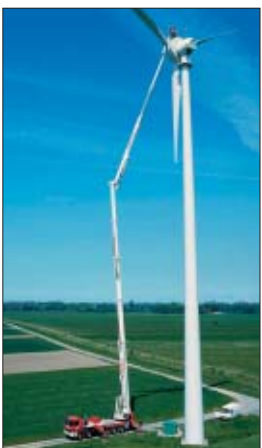
Höhenstar bei mateco: Die LKW-Arbeitsbühne LT 880 KD mit 88 m Arbeitshöhe.

Scholpp besitzt ein breites Know-how und Equipment für nahezu alle Gewichtsklassen, um die verschiedensten Anforderungen in den Bereichen Maschinenmontagen, Produktionsverlagerungen und Hebeleistungen zu entsprechen.