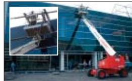
Schwierige Aufträge gibt es bei mateco nicht – nur gute Lösungen.

In der Paderewskiegostraße in Katowice gab es nur einen Supermarkt. Für den Umbau zum modernen Einkaufszentrum, dem „Nasze-Centrum Belg“, benötigte die Fassadenbau-Firma Imperior eine Teleskop-Arbeitsbühne T 160. Weitere zwei Arbeitsbühnen kamen im Innenraum zum Einsatz.