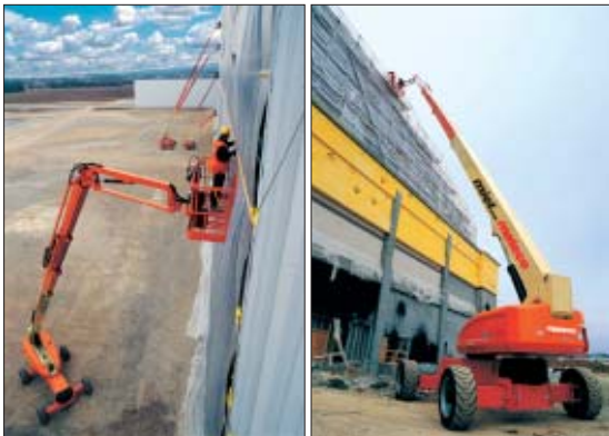
Arbeiten in bis zu 43 m Höhe können ab sofort mit der neuen T 432 K D 4x4 S von mateco sicher, schnell und effektiv erledigt werden.

Die mateco AG hat ihre Marktposition im Jahr 2004 weiter ausgebaut. Durch die Erweiterung und Erneuerung des Geräte- bzw. Fuhrparks sichert mateco ihren Kunden weiterhin wichtige Wettbewerbsvorteile durch die Bereitstellung modernster Zugangstechnik mit höchsten Sicherheitsstandards.