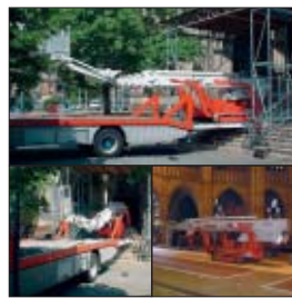
Die XT 355 K D/E KE – mit Geschick und Geduld auf dem Weg ins Kirchenschiff.

Problem war nicht nur das schwierige Rangieren des Tief- laders auf engstem Raum, da gegenüber der Treppen ein Gebäude steht und eine Stra-