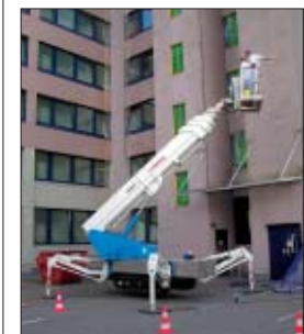
Beidseitige Abstützung und eine Arbeitshöhe von 22 m waren gefordert.

Die Firma Maltec musste der BfA Berlin einen neuen Anstrich geben. Bei der Bewältigung dieser Aufgabe auf einer Tiefgarage bei einer hohen seitlichen Reichweite in 22 m Höhe wurde ein leichtes Arbeitsgerät benötigt. Geradezu ein prädestiniertes Einsatzgebiet für unsere XT 300 K D/E KE.