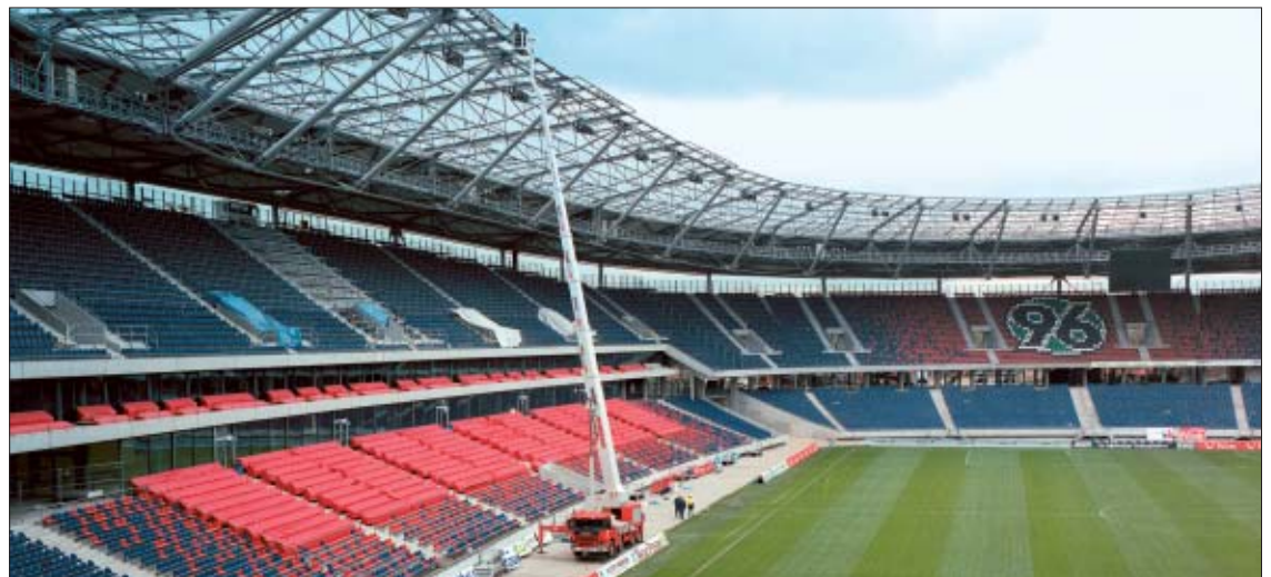
Bei der Endabnahme der AWD-Arena Hannover kam im Innenraum die LKW-Arbeitsbühne LT 570 KD erfolgreich zum Einsatz.

Zum Ende der Arbeiten kam die LKW-Arbeitsbühne LT 570 KD – mit 57 m Arbeitshöhe und 41 m maximaler seitlicher Reichweite – im Innenraum der Arena zum Einsatz. Dort überzeugte sie durch ihre kompakten Ausmaße und konnte so in der gesamten Arena verfahren werden, ohne dass z. B. der empfindliche Rasen beschädigt wurde.