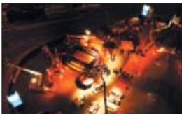
Bei Einbruch der Dunkelheit wurde das Gelände stimmungsvoll beleuchtet.