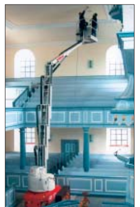
Mit der T 120 KES gelangen Sie in verwickelteste Ecken vom Arbeitskorb aus.

Mit der T 120 KES konnten die Arbeiten sicher und professionell durchgeführt werden.