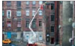
In der Armii Krajowejstraße wurde eine neue Etagegasheizung eingebaut.

Eine neue Etagegasheizung musste die Firma Rajca und Sohn in Chorow-Batory in ein fast 80 Jahre altes Gebäude einbauen. Die schwere Zugänglichkeit machte den Einsatz einer Teleskop-Gelenk-Arbeitsbühne TG 144 D erforderlich. Wie immer war unser Stammkunde rundum zufrieden.