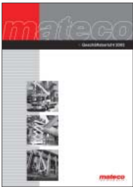
Das wichtigste Instrument der Finanzkommunikation zu unseren Kunden und Partnern ist der Geschäftsbericht.

DER ERSTE GESCHÄFTSBERICHT DER MATECO AG FÜR DAS GESCHÄFTSJAHR 2003