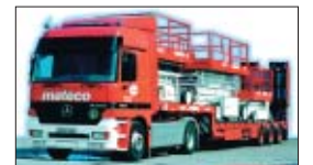
Transport von Arbeitsbühnen.

Zum 01.01.2005 wird die LKW-Maut in Deutschland eingeführt. Neben den unmittelbaren Mautgebühren haben wir nach Einführung der Maut noch weitere Kosten, bedingt durch Verwaltung und Steuerung innerhalb des Unternehmens sowie der Vorfinanzierung der Maut, zu verkräften. Wir sehen uns daher veranlasst, Ihnen ab Einführung der LKW-Maut die uns entstehenden Kosten mit aktuell 16 Cent pro Mautkilometer für den An- und Abtransport unserer Arbeitsbühnen mit unseren eigenen Transportfahrzeugen in Rechnung zu stellen. Im Gegensatz zu unseren Transportfahrzeugen sind unsere LKW-Arbeitsbühnen (selbstfahrende Arbeitsmaschinen) nicht mautpflichtig.