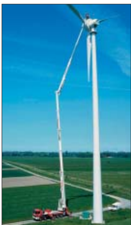
Höhenstar bei mateco: Die LKW-Arbeitsbühne LT 880 KD mit 88 m Arbeitshöhe.

Scholpp besitzt ein breites Know-how und Equipment für nahezu alle Gewichtsklassen, um die verschiedensten Anforderungen in den Bereichen Maschinenmontagen, Produktionsverlagerungen und Hebeleistungen zu entsprechen.