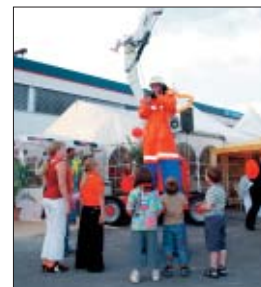
Nicht nur die kleinen Besucher mussten weit nach oben blicken.

Die Kooperation mateco-Kalveram wird von beiden Unternehmen als zukunftsweisendes und viel versprechendes Pilotprojekt betrachtet.