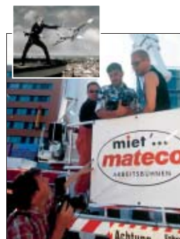
Georgiew fotografiert Rudolf Schenker für seine Sammlung Mannsbilder.

Um Rudolf Schenker, dem Gitarristen der Scorpions, auf dem VW-Turm am Raschplatz in Hannover in 87 Meter auf Augenhöhe zu begegnen und ihn nahe am Abgrund perfekt zu fotografieren, waren die Dienste der größtmöglichen mateco-Arbeitsbühne gefragt.