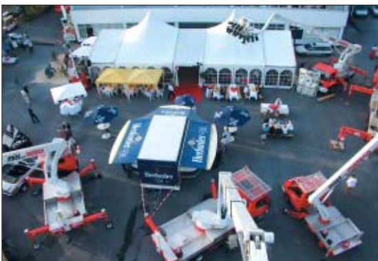
Mit mateco und der Josef Kalveram GmbH + Co. KG in schwindelerregende Höhe: Ein Blick von oben war nur den höhenfesten Besuchern gewährt.