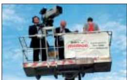
Die Geschäftsleitung von Studio Hamburg ließ sich in die Höhe befördern.