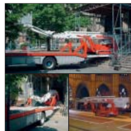
Die XT 355 K D/E KE – mit Geschick und Geduld auf dem Weg ins Kirchenschiff.

Problem war nicht nur das schwierige Rangieren des Tief- laders auf engstem Raum, da gegenüber der Treppen ein Gebäude steht und eine Stra-