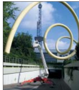
Die Berliner Firma Rossow arbeitete mit einer XT 252 B/E KE am Rohrkunstwerk.

Das Rohrkunstwerk auf dem Messegelände Berlin bedurfte eines neuen Anstrichs. Die Firma Rossow und mateco kamen zur günstigsten Lösung: Die Unterführungsschräge und erforderliche leichte Bauweise zur Gehwegstellung bedeuteten den Einsatz der Extra-Arbeitsbühne XT 252 B/E KE.