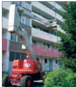
Zeitersparnis mit der TG 264 K D 4x4 S gegenüber einer Anhängerbühne.

Fassadensanierung am Seniorenheim in Berlin, Ketschendorfer Weg, lautete der Auftrag für die Firma Wentzel & Belling aus Zepernick. Die schmale, kompakte Bauweise sowie eine Wegbreite von 2,50 m ließen nur den Einsatz einer Teleskop-Gelenk-Arbeitsbühne TG 264 K D 4x4 S zu.