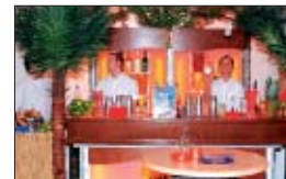
Die köstlichen Cocktails wurden teilweise artistisch geschüttelt.