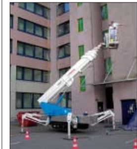
Beidseitige Abstützung und eine Arbeitshöhe von 22 m waren gefordert.

Die Firma Maltec musste der BfA Berlin einen neuen Anstrich geben. Bei der Bewältigung dieser Aufgabe auf einer Tiefgarage bei einer hohen seitlichen Reichweite in 22 m Höhe wurde ein leichtes Arbeitsgerät benötigt. Geradezu ein prädestiniertes Einsatzgebiet für unsere XT 300 K D/E KE.