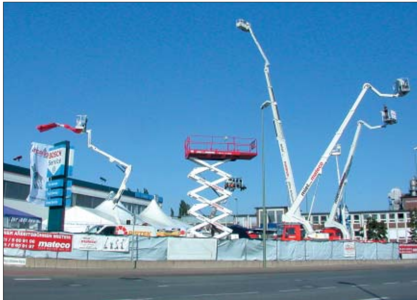
Hoch hinaus ging es bei der Eröffnungsfeier am 10. September 2004 auf dem Firmengelände in Bielefeld.