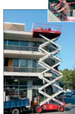
Eine Scheren-Arbeitsbühne der mateco Hellas im Einsatz für Olympia.

Um das erforderliche, sperrige Equipment schnell und trotzdem sicher zu bewegen, fungierte eine Scheren-Arbeitsbühne der mateco Hellas als Transportaufzug.